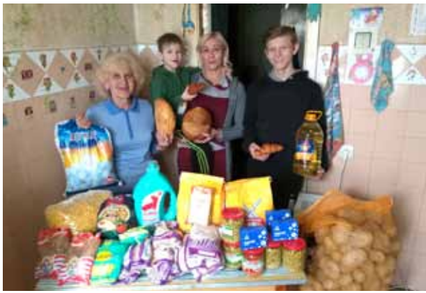
fam. Narmol - oma en moeder met twee kinderen