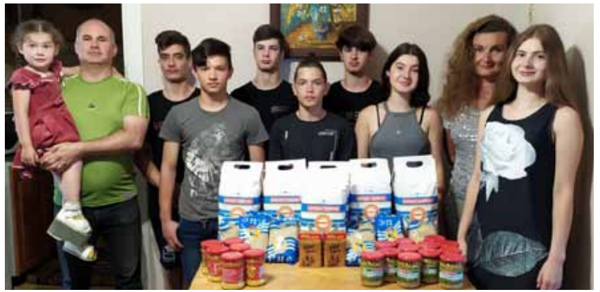
fam. Azai - gezin met vier pleegkinderen